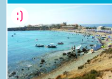
;) Wyspa Tabarca

POZA MAPĄ (20 km): U wybrzeży Alicante leży niewielka, ale klimatyczna wyspa Tabarca. Szeroka na zaledwie 2 km dzieli się na 2 części: niezamieszkałą (pełną wydm i porośniętą opuncjami) oraz zamieszkałą (z rynkiem, kościołem i murami, wielki temu chroniący osadę przed piratami). Do Tabarki dotrzećze promem Cruceros Kontiki wypływającym z portu w Alicante.