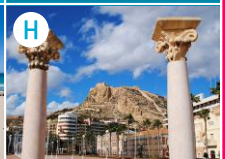
H Kolejka na Zamek św. Barbary