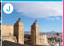
J Zamek św. Ferdynanda