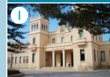
I MARQ - Muzeum Archeologiczne