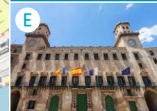
E Plac Ratuszowy (Ayuntamiento)