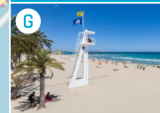
G Plaża Postiguet