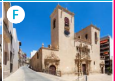
F Bazylika NMP