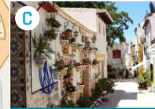
C Dzielnica Santa Cruz