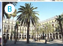
B Plac Królewski (Plaça Reial)