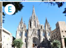
E Katedra św. Eulalii i uliczka Carrer Bisbe