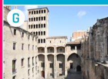
G Plac Króla (Plaça del Rei)