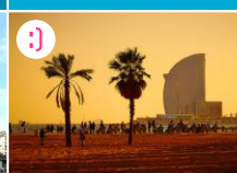
K Plaże Barcelonety

POZA MAPĄ (2-5 km): A właściwie cześćiowa na mapie! Plaże na Barcelonie ciągnie się kilometrami zarówno na północ, jak i na południe od oznaczenia na mapie. Popularność swą plaże zawdzięczają zwłaszcza bliskości stacji metra Barceloneta, a także Ciutadella/Villa Olímpica. A zatem wykorzystajcie słoneczny dzień, pływając w Marzu Środkim!