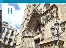
H Bazylika NMP Morza (Santa Maria del Mar)