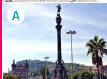
A Panorama ze statuy Kolumba przy porcie