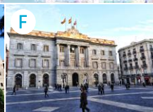
F Plac św. Jakuba (Plaça Sant Jaume)