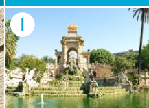
I Park Ciutadella