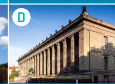
D Wyspa Muzeów