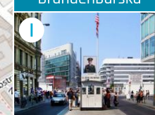
I Fragment Muru i Checkpoint Charlie