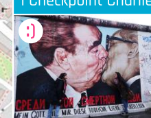
J East Side Gallery - wolność na murze

POZA MAPĄ (3 km): EastSideGallery to świadek historii, a zarazem galeria, będąca mekką dla artystów-graficyzmy od chwili upadku Berlińskiego Muru w 1989. Najprostszy sposób dotarcia do ów berlińskiego hołdu dla wolności to złapanie autobusu 248 (w kierunku Warschauer Straße) pod Ratuszem lub z Alexanderplatz (Grunerstraße). Wsiadka na przystanku East Side.