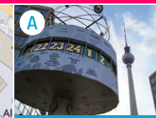
A Alexanderplatz z wieżą telewizyjną