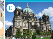
C Katedra Berlińska (Berliner Dom)