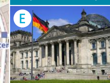
E Gmach Parlamentu Rzeszy