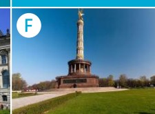
F Ogrody Tiergarten (widok na Kolumnę Zwycięstwa)