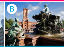
B Czerwony Ratusz