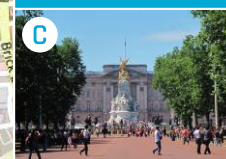
C Deptak The Mall i Pałac Buckingham