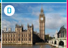
D Parlament i Opactwo Westminsterkie