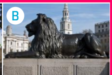
B Plac Trafalgar