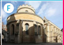
F Kościół Templariuszy (Temple Church)