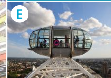
E Diabelski młyn Eye of London