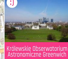
J Królewskie Obserwatorium Astronomiczne Greenwich

POZA MAPĄ (10 km): Sposobów na spędzenie wolnego czasu w Londynie i okolicy mamy mnóstwo: od muzeów w dzielnicy Kensington (bliżej) po wypadki do pięknych miast uniwersyteckich - Oksfordu i Cambridge (dalej). My proponujemy Wam coś pośrodku: Greenwich, przez które przebiega południk zerowy. Dostaniecie się tam np. koleją z CANNON STREET.