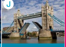
J Most Tower