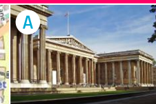
A Muzeum Brytyjskie