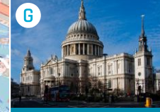
G Katedra św. Pawła