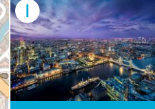
I Widok na Londyn z wieżowca The Shard