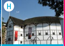
H Teatr Szekspira The Globe