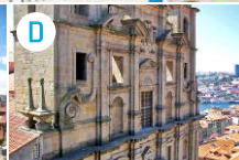
Kościół Świerszczy (Św. Wawrzyńca)