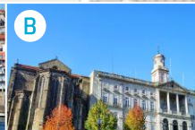
Pałac Giełdy i kościół św. Franciszka