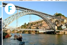
Most Ludwika I (Ponte de D. Luís)