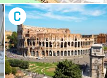
C Koloseum i łuk Konstantyna