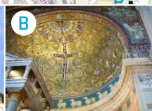
B Bazylika św. Klemensa z mitreum