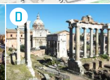
D Forum Romanum i wzgórze Palatyn