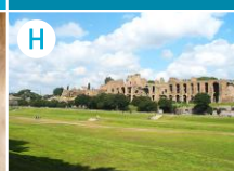
H Circus Maximus