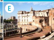
E Forum Trajana