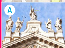
A Laterańska Bazylika św. Jana i Święte Schody

STAROŻYTNA I WIECZNA ROMA AETERNA (7 km)