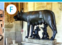
F Muzea Kapitołńskie z Wilczyccą