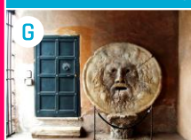
G Usta Prawdy (Bocca della Verita)