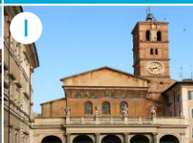
I Bazylika NMP na Zatybrzu