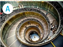
A Muzea Watykańskie z Kaplicą Sykstyńską