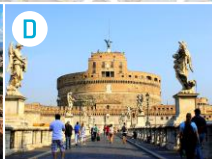
D Zamek św. Anioła (Castel Sant'Angelo)