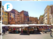
Giordano Bruno na Campo di Fiori