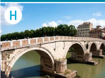
H Most Sykstusa na Tybrze