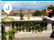
J Taras Gianicolo na Piazza Garibaldi