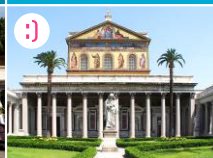
K Bazylika św. Pawła za Murami

POZA MAPĄ (4 km): Jedną z czterech bazylik papieskich, znajdujących się na obszarze Rzymu i Watykanu to według chrześcijańskiej tradycji miejsce pochówki św. Pawła. Aby dotrzeć do Bazyliki z przystanku LUNGOTEVERE SANZIO/FILIPPERI przy Moście Garibaldiego złapcie autobus nr 23 (linia PINCHERLE/PARRAVANO), zaś wysiadajcie na przystanku VIALE DI SAN PAOLO naprzeciwko Bazyliki.