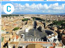
C Plac św. Piotra