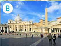
B Bazylika św. Piotra