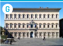
G Pałac Farnese (Ambasada Francji)