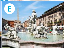
E Piazza Navona