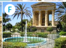
Ogrody Barrakka Dolne