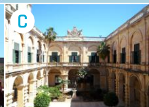
Pałac Wielkich Mistrzów