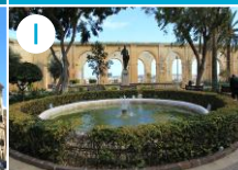
Ogrody Barrakka Górne