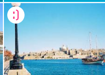
Sliema - cudowna panorama Valletty

POZA MAPĄ (2 km): Jeśli podczas zwiedzania Valletty pozostają Wam wolne 2 godziny do zagospodarowania, popłyńcie do Sliemy, skąd rozciąga się iście początkowa panorama stolicy. Wsiądźcie na prom, odpływający co ok. 30 minut z dedykowanego terminalu (nie w Wielkim Porcie), a dokończycie do brzegu w Sliemie, skierujcie się na półwysep Tigné.