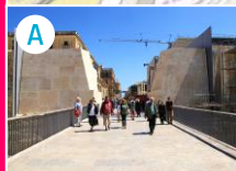
Brama miejska i mury obronne