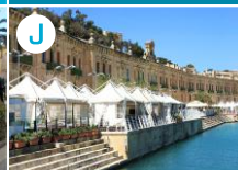
Nabrzeże nad Wielkim Portem