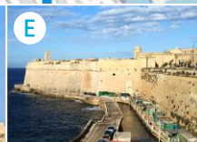
Fort św. Elma