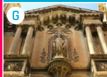
Kościół Wraku św. Pawła