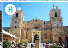
Konkatedra św. Jana