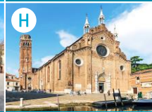
Kościół Santa Maria Gloriosa dei Frari