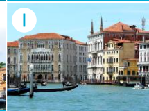
Uniwersytet Ca' Foscari