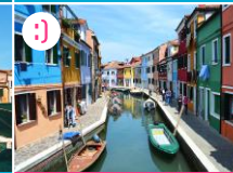
Burano - feeria barw i szklanych cudów

POZA MAPĄ (7 km): Jeśli podczas zwiedzania Wenecji, został Wam czas wolny (minimum 3h) wyruszcie na sąsiednie wyspy laguny. Polecamy Wam zwłaszcza Burano, która słynie z kolorowych fasad kamienic oraz z wyrobów ze szkła. Złapcie tramwaj wodny linii 4.1 np. z przystani Orto (ikonka na mapie). Z Orto rozpościera się też piękny widok na wenecką lagunę.