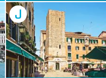
Plac Campo Santa Margherita