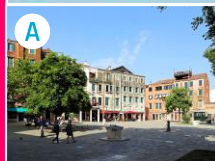
Plac Campo Ghetto Nuovo