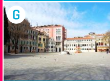
Plac Campo San Polo