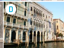
Pałac Ca' d'Oro