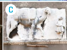
Ca' Mastelli i Campo dei Mori