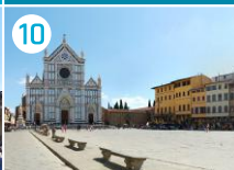
10 Bazylika Santa Croce (Świętego Krzyża)