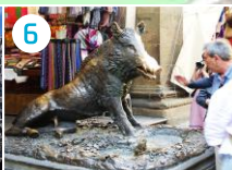
6 Loggia Mercato Nuovo z figurą Il Porcellino