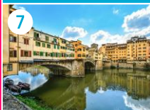
7 Ponte Vecchio (Most Złotników)