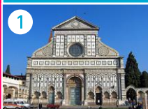
1 Kościół Santa Maria Novella

KOLEBKA RENESANSU NA PRAWYM BRZĘGU ARNO (5 km)