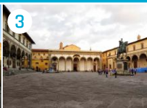
3 Piazza Santissima Annunziata