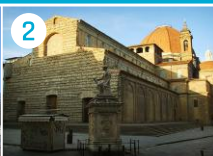
2 Bazylika San Lorenzo (Św. Wawrzyńca)