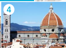
4 Katedra Santa Maria del Fiore z kampanilą