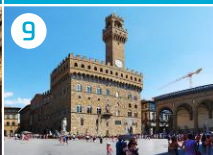
9 Piazza Signoria z Palazzo Vecchio