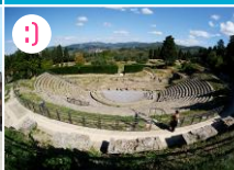
11 Fiesole - antyczne ruiny i panorama

POZA MAPĄ (10 km): Aby zobaczyć muzealny kompleks ruin etrusko-rzymskich pod gołym niebem i by zachwyć się rozległą panoramą Florencji ze wznieślenia Fiesole, złapcie autobus 7 z VIA LA PIRA zaraz przy Piazza San Marco. Jedźcie nim do samego końca (do przystanku Piazza Mino w Fiesole). Florencki autobus miejski numer 7 kursuje z frekwencją co 20 minut.