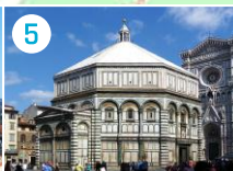
5 Baptysterium św. Jana