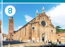
Kościół Santa Maria Gloriosa dei Frari