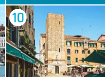
Plac Campo Santa Margherita