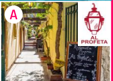
Restauracja - Pizzeria i ogród w sercu Wenecji

PLACE I PAŁACE WZDŁUŻ CANALE GRANDE (5 km)