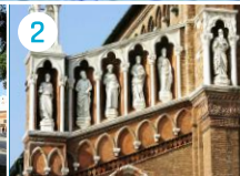
Kościół Madonna dell'Orto