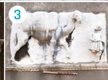
Ca' Mastelli i Campo dei Mori