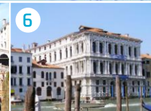
Pałac Ca' Pesaro