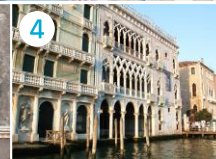
Pałac Ca' d'Oro