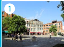
Plac Campo Ghetto Nuovo