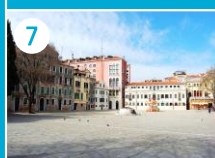
Plac Campo San Polo