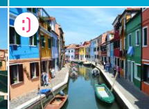
Burano - feeria barw i szklanych cudów

POZA MAPĄ (7 km): Jeśli podczas zwiedzania Wenecji, został Wam czas wolny (minimum 3h) wyruszcie na sąsiednie wyspy laguny. Polecamy Wam zwłaszcza Burano, która słynie z kolorowych fasad kamienic oraz z wyrobów ze szkła. Złapcie tramwaj wodny linii 4.1 np. z przystani Orto (lłokna na mapie). Z Orto rozpościera się też piękny widok na wenecką lagunę.