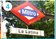
4 Dzielnica La Latina