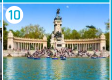
10 Park Retiro

POZA MAPĄ (5 km): "Królewski dzień" w stolicy Hiszpanii niechaj zwycięży fascynująca wizyta na stadionie i w klubowym muzeum Realu Madryt - zespolu nazywanego popularnie "Królewskimi". Bez trudu dojedziecie na stadion metrem m.in. ze stacji PRINCIPE PIO, wsiadając do wagonu linii nr 10 (bezpośrednio) lub z ATOCHA z przesiadką na TRIBUNAL. Postarajcie się też o bilety na mecz! Stadion Santiago Bernabéu