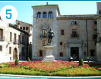
5 Plaza de la Villa