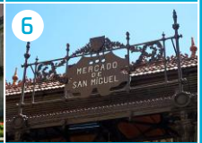
6 Hala targowa San Miguel