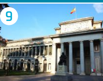
9 Muzeum Prado