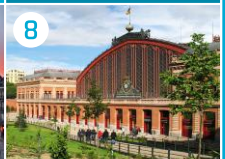
8 Dworzec Atocha