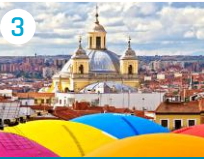
3 Bazylika św. Franciszka