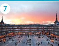
7 Plaza Mayor